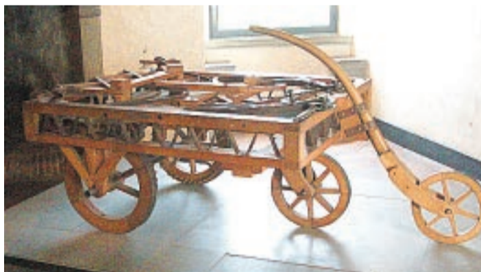
IKKE HELT AUTO. Bil med «motor», modell på Da Vinci-museet i byen Vinci.