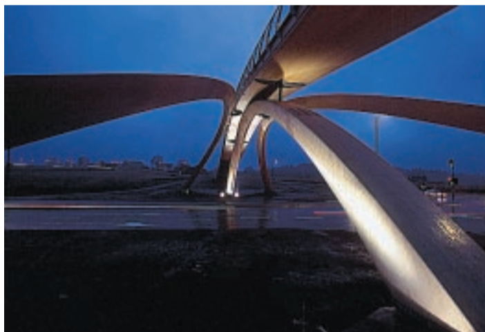
BROBYGGER. Gang- og sykkelbroen ved Nygårdskrysset utenfor Oslo er laget av den norske kunstneren Vebjørn Sand etter da Vincis 500 år gamle tegninger.