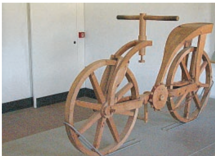
PEDALKRAFT. Denne sykkel er bygget etter Da Vincis tegninger.

Men saken ble droppet i all stillhet, for var det noe Leonardo da Vinci ikke manglet, var det innflytelsesrike venner og høye beskyttere.